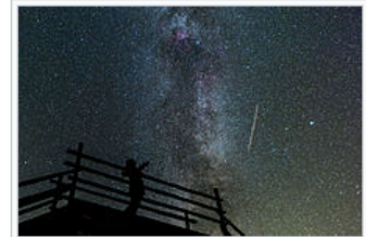
Observer is someone who gathers information about observed phenomenon, but does not intervene. Observing the air traffic in Rõuge, Estonia.

Observation is the active acquisition of information from a primary source . In living beings, observation employs the senses . In science, observation can also involve the recording of data via the use of instruments. The term may also refer to any data collected during the scientific activity. Observations can be qualitative , that is, only the absence or presence of a property is noted, or quantitative if a numerical value is attached to the observed phenomenon by counting or measuring .