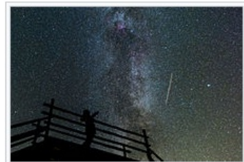
观察者是收集观察现象的信息、但不对其进行干预的人。在爱沙尼亚Rõuge观察空中交通。

注意保存的时候不要留没有来及翻译的内容。参见（See also）、参考文献（References）和外部链接（External links）记着保留。