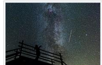
Observer is someone who gathers information about observed phenomenon, but does not intervene. Observing the air traffic in Rõuge, Estonia.

好多链接都翻译好了吧。这蓝色的，就是链接到其他中文维基条目的链接；红色的就是找不到中文条目的。